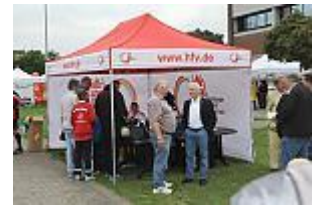
Jugendfußball-Saisoneneröffnung beim HFV am 17.08.2014